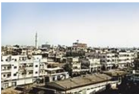
De skyline van Hodeidah.

Dit is een gezicht over de stad Hodeidah, aan de Rode Zee. Bid dat het evangelie diep door mag dringen bij de ongeletterde meerderheid en voor de ontwikkeling van radio- en tv-uitzendingen toegespitst op de Jemenitische cultuur.