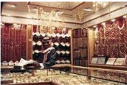
Riyadh , 'Ar-riyad

Riyadh is een belangrijk transportcentrum. Het is het centrum van het nationale wegennetwerk dat noordelijke, zuidelijke, oostelijke en westelijke provincies verbindt. Er is ook een treinverbinding tussen Riyadh en Dammam, zowel voor personenvervoer als voor goederentransport.